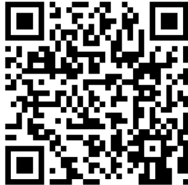
QR-Code Meine Umwelt-App

Weitere Informationen zur Asiatischen Hornisse und wie sich die Art von heimischen Insekten unterscheiden lässt finden sich auf der Homepage der LUBW https://www.lubw.baden-wuerttemberg.de/natur-und-landschaft/asiatische-hornisse sowie auf der Homepage der Landesanstalt für Bienenkunde der Universität Hohenheim unter https://bienenkunde.uni-hohenheim.de/vespavelutina . Dort finden sich auch weitere Informationen, wie Bürgerinnen und Bürger aktiv bei der Suche nach Tieren und Nestern mitwirken können. Seit April 2024 koordiniert die Landesanstalt für Bienenkunde in Stuttgart-Hohenheim im Auftrag der Naturschutzverwaltung das landesweite Management der Asiatischen Hornisse (Kontakt siehe Homepage).